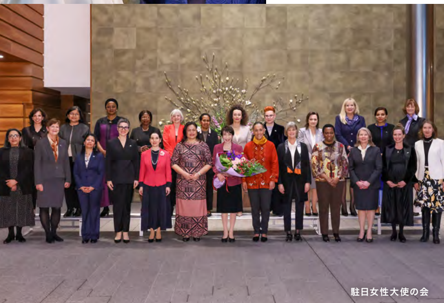
駐日女性大使の会