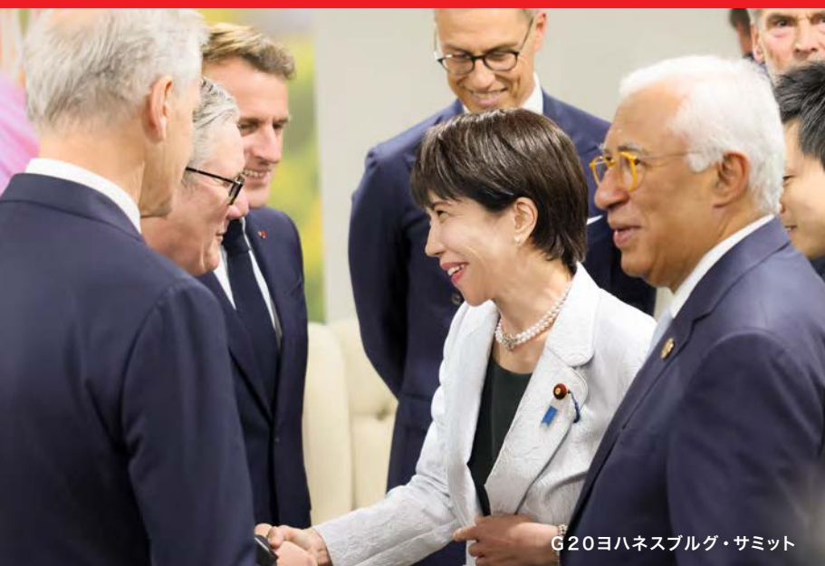
G20ヨハネスブルグ・サミット