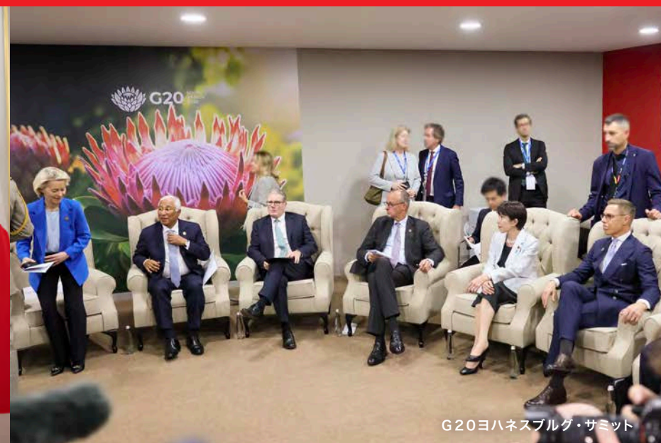
G20ヨハネスブルグ・サミット