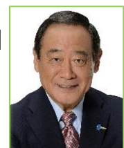
大西 英男 衆・東京16区