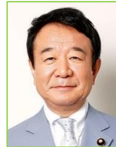
青山 繁晴 参・比例代表