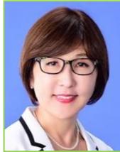
稲田 朋美 衆・福井1区