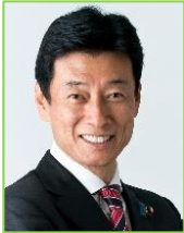
西村 康稔 衆・兵庫9区