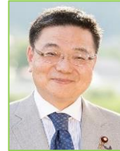
古川 康 衆・佐賀2区