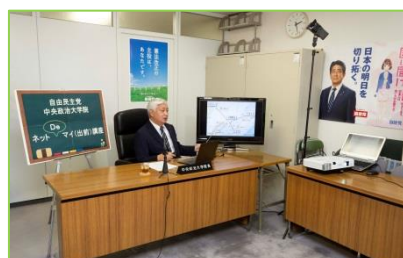
第9回 中谷 元 学院長 「日本の領土・領海・領空を守る—最近の中国軍の動き—」