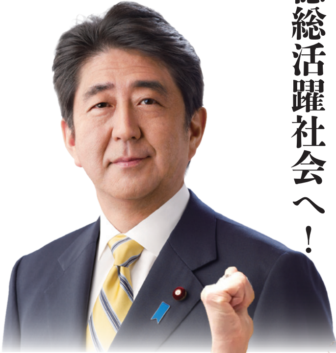
自民党総裁 安倍晋三